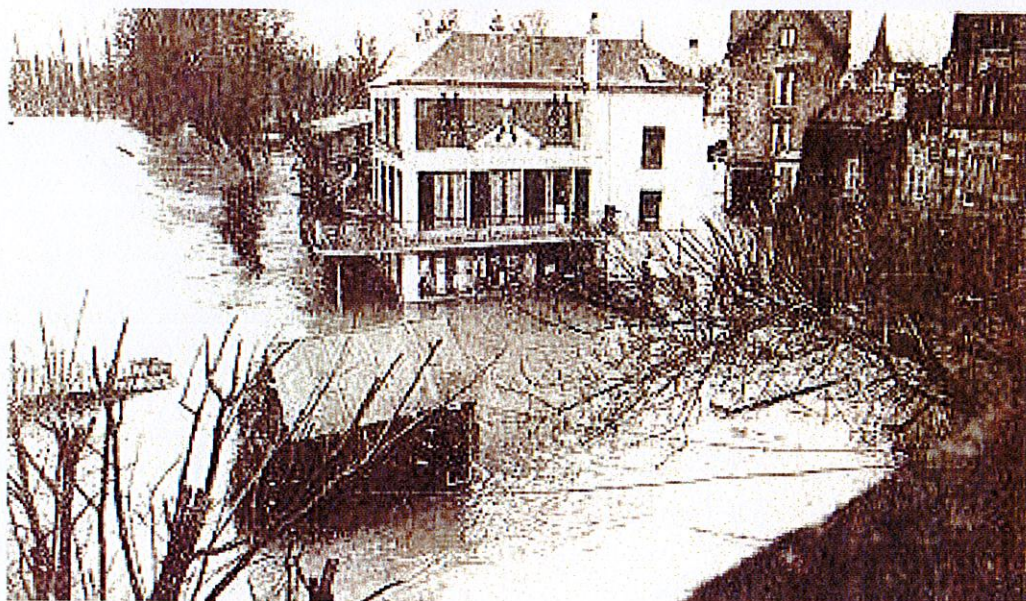
Collection Le Fil du Temps © Chantal Leduc