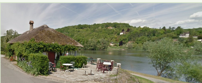
Chez Charlot : cuisine française à LAVACOURT 12 Promenade Claude Monet MOISSON—01 34 79 30 06