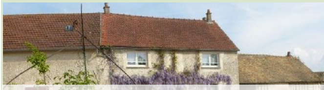
Le Coignet : Logement 3 chambres — 5pers 1, rue des Rotys NEAUPHLETTE