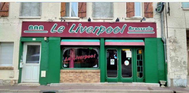
Le Liverpool 12 Place de Maréchal Leclerc BREVAL—01 34 78 01 00