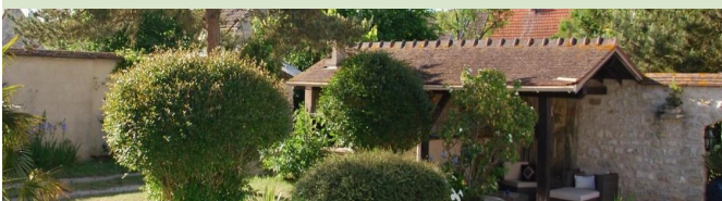
Le Prieuré Maïalen : Logement 2 chambres — 4 pers 4, allée du Jamboree MOISSON—LAVACOURT