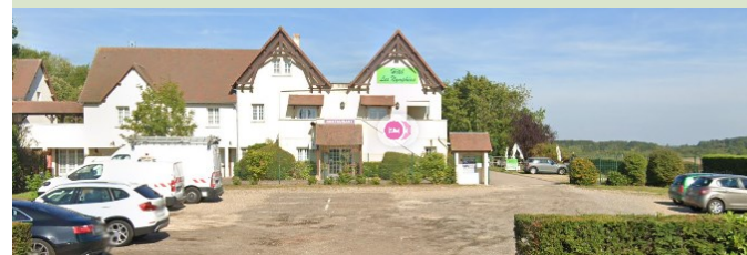
Les Nymphéas : Logements sobres : restaurants, bar accès WIFI Sur la N13 CHAUFOR LES BONNIERES