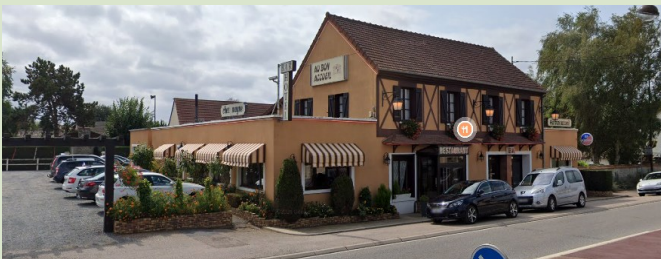
Au Bon Accueil : restaurant routier et gastronomique Sur la N13 CHAUFOR LES BONNIERES—01 34 76 11 29