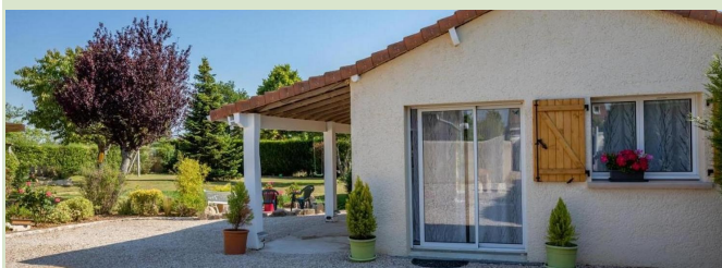
La petite Californie : Une maison — 3 pers 11, rue de la Couture SAINT ILLIERS-LA-VILLE