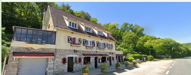
L'Envy : cuisine française Sur la 915 NOTRE DAME DE LA MER—01 30 93 01 00