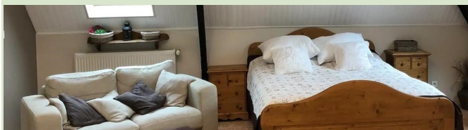
Le Seize : Logement 3 chambres — 6pers 11, Place Rouillé BENNECOURT